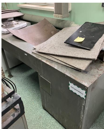
18. Stół spawalniczy MZSO 2000 z odciąganiem, nr inw. 6-0481, proponowana cena odsprzedaży – 1260,00 zł