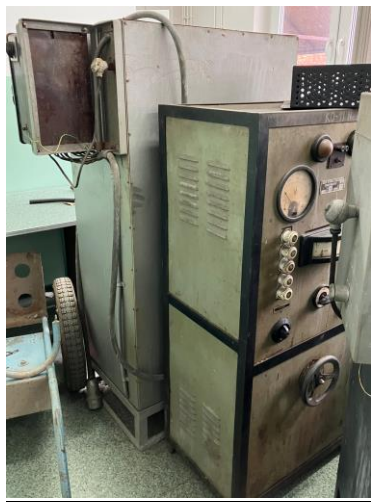
13. Grawerka MP-200M, rok produkcji 1973, nr inw. N3-127, proponowana cena odsprzedaży – 3150,00 zł